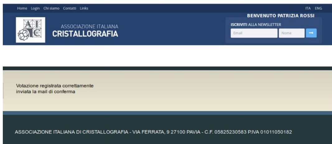
Figura 7: La procedura è finita il voto è stato registrato.